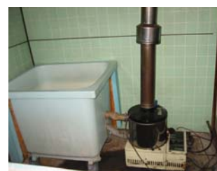
浴槽をまたぐのが大変でした