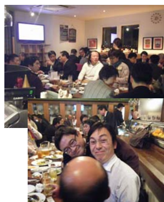
飲んで、笑って、大いに盛り 上がりました！