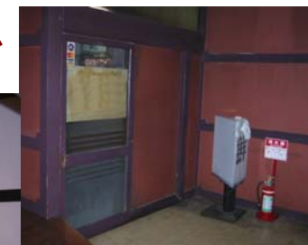
エントランスは木製の引き戸でした