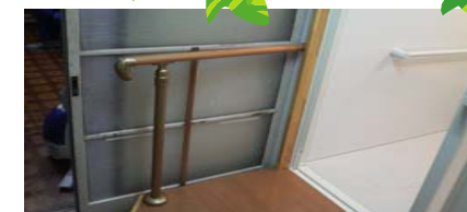
浴室出入口前後には手すりを取付けて、更に安全に配慮しました。

ようやく完成し、お施主様ご家族がお泊りにいらした夜は、みんなでワイワイ賑やかにお風呂に入られたそうです。目を閉じると、湯けむりの向う側に浮かぶ仲良しほんわか家族の笑顔。私達の方が心の芯から暖めて頂きました。本当にありがとうございました。