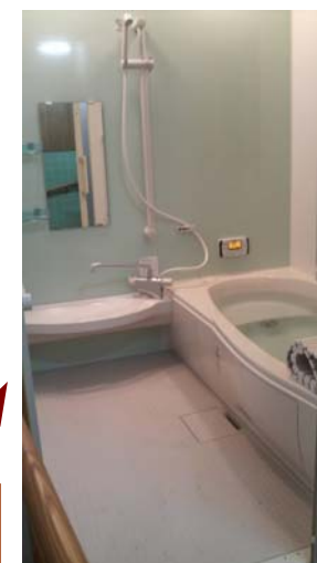
ゆったりと、安全に入れるようになりました